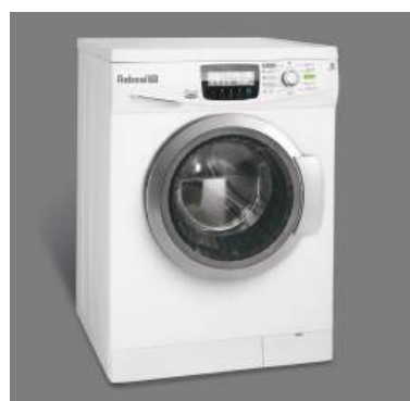
• رنگ سفید با در نقره ای WRE7312-SD