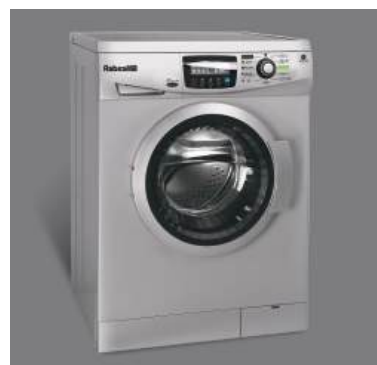
• رنگ نقره ای WRE7312-S